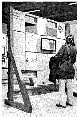
Un des panneaux de l'exposition